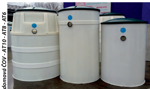
domová ČOV - AT10 - AT8 - AT6