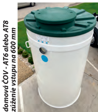
domová ČOV - AT6 alebo AT8 zúženie vstupu na 600 mm